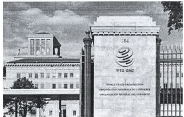
WTO Headquarters, Geneva